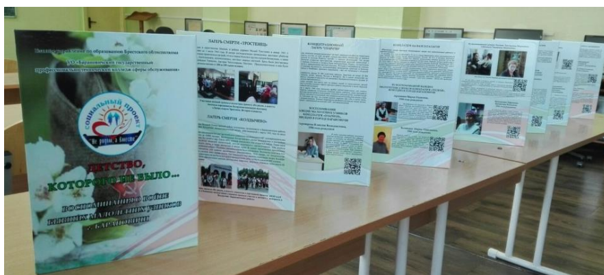
Рисунок 2. «Детство, которого не было...», книга воспоминаний с Qr-кодами

Воспоминания участников целевой группы проекта «Не рядом, а вместе» легли в основу книги «Детство, которого не было...», которую волонтеры проекта писали в течение двух лет. Это более 30 воспоминаний бывших малолетних узников концлагерей. Информация была систематизирована и размещена в книгу, выполненную в форме раскладушки с твёрдыми страницами. Ценность содержания книги заключается в использовании местного материала.