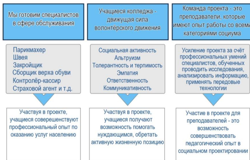
Рисунок 1 – Схема «Преимущества реализации соцпроектов в учреждениях ПТО»

Воспоминания участников целевой группы проекта «Не рядом, а вместе» легли в основу книги «Детство, которого не было...», которую волонтеры проекта писали в течение двух лет. Это более 30 воспоминаний бывших малолетних узников концлагерей. Информация была систематизирована и размещена в книгу, выполненную в форме раскладушки с твёрдыми страницами. Ценность содержания книги заключается в использовании местного материала.