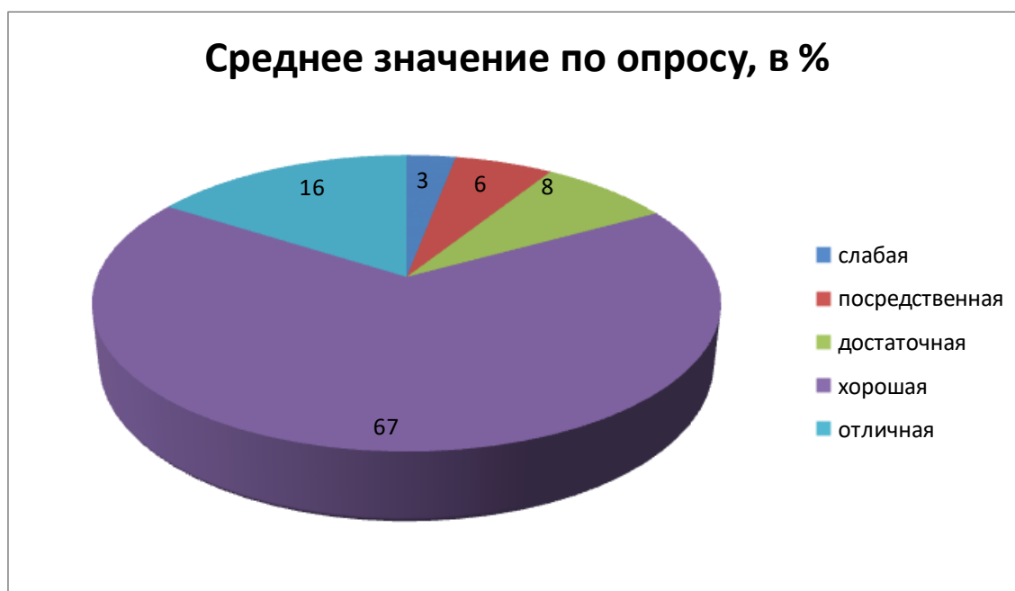
Рисунок 1 - Роль профсоюзной организации учащихся

Распределение баллов сложилось следующим образом (рисунок 1).